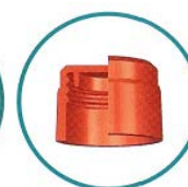
Bouchon à vis Screw cap