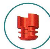
Cape à ailettes Winged plug