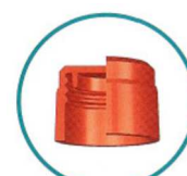
Bouchon à vis Screw cap